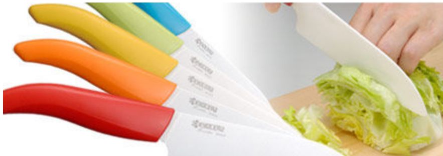
KYOCERA 14CM CERAMIC KNIFE

京瓷陶瓷刀 14CM $499.0/@ (Original Price $899.0/@)