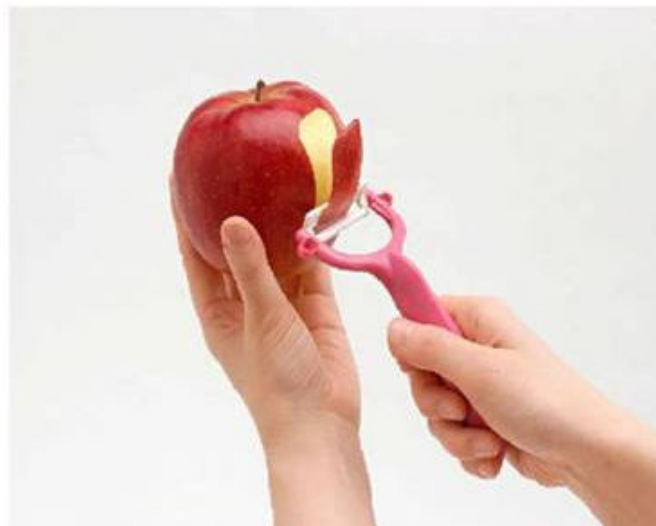
KYOCERA CERAMIC PEELER

京瓷超薄抗菌砧板 $120.0/@ (Original Price $150.0 /@)