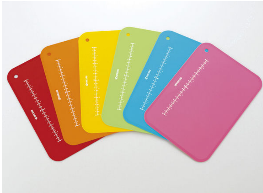
KYOCERA CERAMIC CHOPPING BOARD

京瓷超薄抗菌砧板 $120.0/@ (Original Price $150.0 /@)